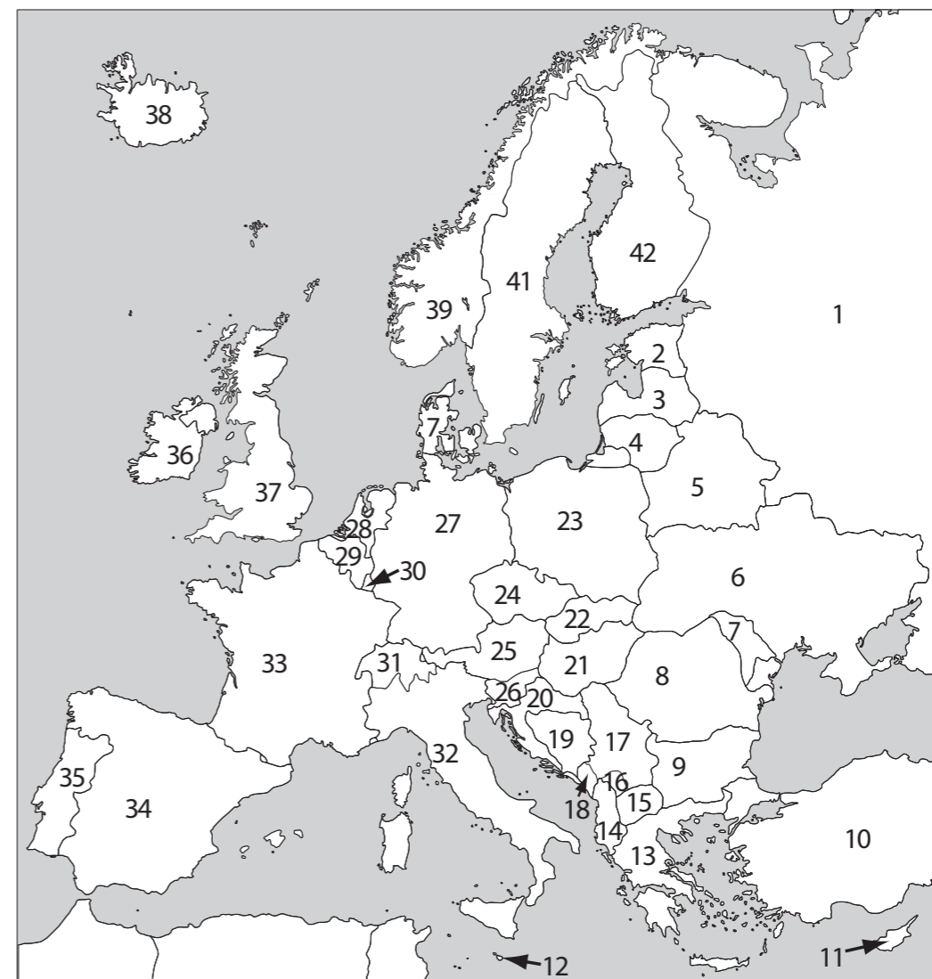
SA INNOVE RIIGIKSAM ÜHISKONNAÕPETUS 2013

Tabelis on kaardil märgitud riikide numbrid. Kirjutage numbrite järel riik ning märkige, kas see kuulub (+) või ei kuulu (-) Euroopa Liitu, euroalasse ja NATOsse. 4 õiget vastust reas – 2 p; 2–3 õiget reas – 1 p; vale riik – rida 0 p.