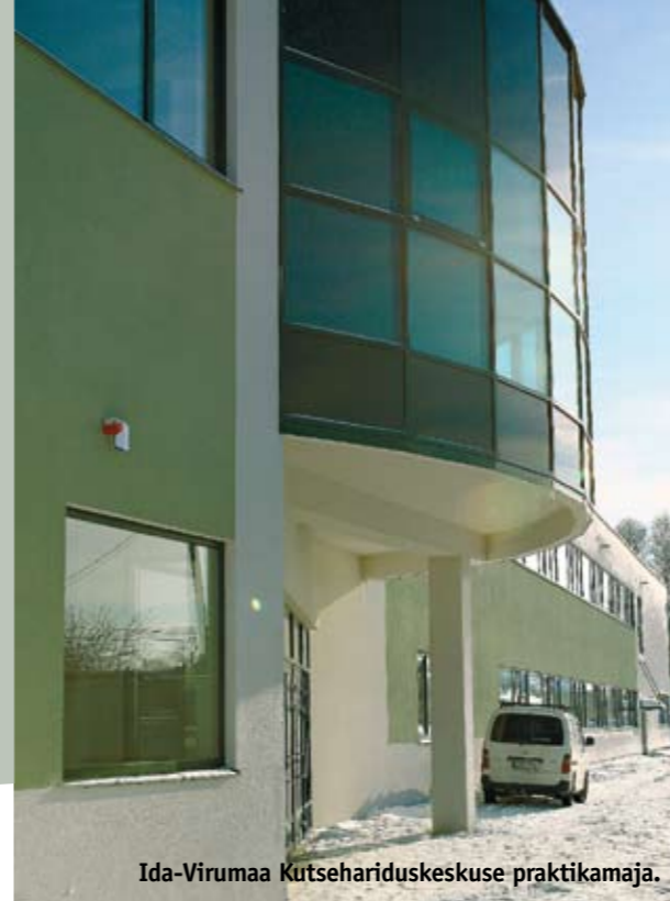
Ida-Virumaa Kutsehariduskeskuse praktikamaja.

Uuri, kas valitud erialal tehakse kutseeksameid ja millistes koolides on see võimalus olemas. Tuleb mees pidada, et osal erialadel pole kutseeksameid üldse olemas. Seda, kas erialal saab teha kutseeksami ja antakse kutsetunnistusi, saab kontrollida Kutsekoja kodulehelt.