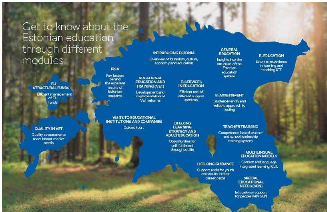
Joonis 1: Eesti haridust tutvustavad 15 koolitusmoodulit.

Välisministeeriumi arengukoostöö projektide raames jagati Eesti parimat praktikat hariduse reformimisel, kaasates vastavate valdkondade spetsialiste, mis aitab kaasa Eesti haridusspetsialistide kompetentsuse kasvule ja tõstab nende motivatsiooni osaleda rahvusvahelises tegevuses.