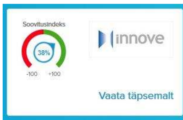
Joonis 4. Recommy koduleheküljel asuv ja pidevalt uuenev Innove soovitusindeks (seisuga 14.02.2018).

Innove kogub kõigilt karjääri- ja õppenõustamisteenuste klientidelt klienditagasisidet. Soovitusindeks karjääriteenustes on stabiilselt tõusnud, jõudes 34%-ni (skaalal -100% kuni +100%), õppenõustamises on teenusel jätkuvalt ülikõrge soovitusindeks: 71%.