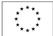
Euroopa Liit Euroopa Sotsiaalfond