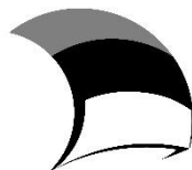
Eesti tuleviku heaks